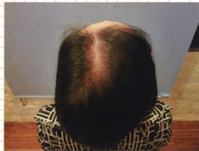
SAIMO®治療4回を施した一例。