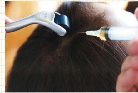
メソラインローラーという、0.5ミリの非常に細かい突起が540本ついたローラーで、頭皮表面のバリアに穴をあけ、薬剤を真皮層に浸透させます。

髪の毛は女の命、なんてセリフがありますが、年齢を重ねるほどに、顔の造作よりも「肌と髪」がより重要になるのを切実に感じる今日この頃。手間とお金を肌にかけるか、髪にかけるかは、意外に難しい問題です。