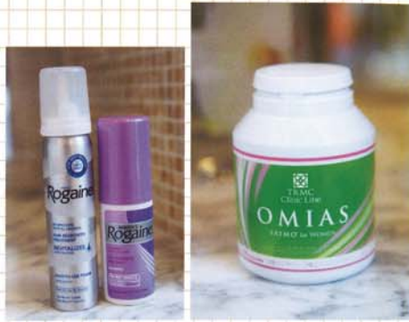
日本人女性に不足しがちな亜鉛や鉄分をはじめ、美しく元気な髪の再生に必要な不可欠なビタミン、パントテン酸、メチオニンを配合。