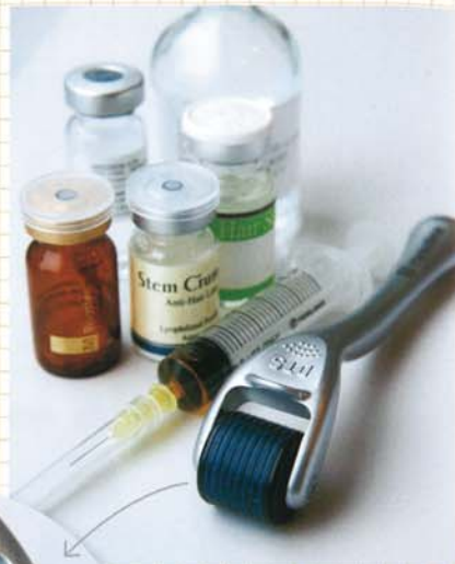
頭皮に浸透させる薬剤は、患者さんの症状に合わせて調合します。